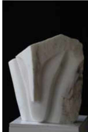
Carrara Marmor

Gastkünstler: Michael Glatzel – Bildhauerei in Stein