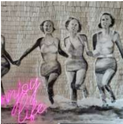
Martina Hamrik · Malerei · Haus B www.martina-hamrik.de

Rot ist die erste Farbe, der der Mensch einen Namen gab, die Farbe aller Leidenschaften, Lebenskraft und Kreativität.